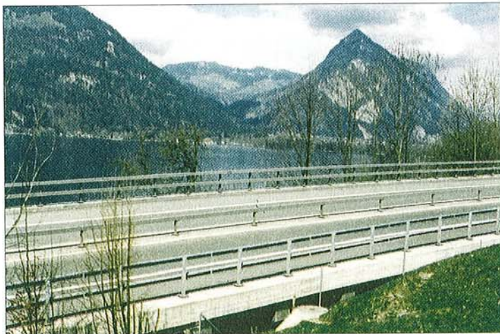
Abb. 3: Brücke (Hangviadukt) der N8 bei Därligen.

Südlich von Därligen am Thunersee in der Schweiz verläuft die Nationalstraße N8 Richtung Thun aus einem Einschnitt heraus auf einen Hangviadukt mit leichter Linkskurve (Abb. 3). Im Winter liegt die Brücke weitgehend im Schatten, und durch die freie Exposition kann Wind die Straße so weit abkühlen, daß sich auf der Brückenfahrbahn im Winter häufig sehr schnell Glatteis bildete, während die anschließenden Strecken noch frei davon waren. Die Folge waren häufige, schwere Unfälle, die auch durch starken Einsatz von Salz und durch Installation eines Frühwarngerätes nicht verhindert werden konnten.