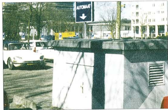
Abb. 2: Brunnenhäuschen eines der beiden Speicherbrunnen auf einem Parkplatz, im Hintergrund Institutsgebäude der Universität

ches für die Trinkwassergewinnung ungeeignet ist. Das Wasser wird mit bis zu 90 °C eingeleitet und mit 83-51 °C zurückgewonnen.