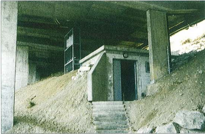
Abb. 5: Betriebsgebäude

oberfläche zu Glatteisbildung kommen. Unter etwa -8\text{ °C} ist die Luft dann jedoch so trocken, daß sich Glatteis nicht mehr bilden kann.